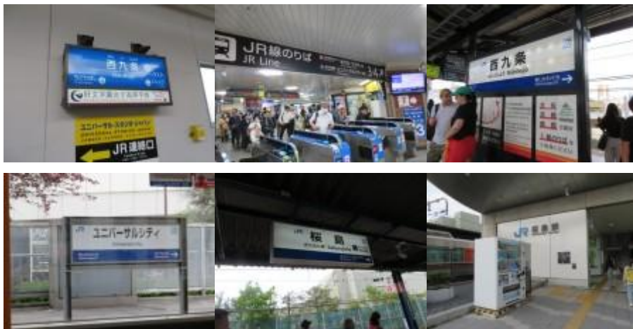
※桜島まで電車で移動

大物から各駅停車で西九条まで戻り、JR ゆめ咲線に乗り換え、15時19分の電車で桜島駅まで移動する。この駅は大阪環状線と合流しており、桜島駅行きの専用のホームがあった。桜島駅には15時27分到着。当初はこのから4.1km先の西九条まで何処も寄り道せずに歩く予定であったが、駅前で沢山の方の姿があったので、係員の方に「何かイベントがあるのですか」と質問する。すると「ここから大阪万博夢洲まで向かう便利なJRバス（往復1,400円）があります。今なら直ぐ乗車可能ですし、また予約チケットがなくても御来場できます」との説明がある。瞬間的に迷ったが、この案内に従うことにする。10分位で会場に到着する。20分位滞在し、万博会場前を撮影後、16時15分のJRバスで桜島駅まで戻る。1970年の万博に比べ、たまたま時間帯が夕方だったので、正しいコメントはできないが、少し観客が少ないような気がした。しかし、何人かの友人に感動の瞬間をSNSで発信する。