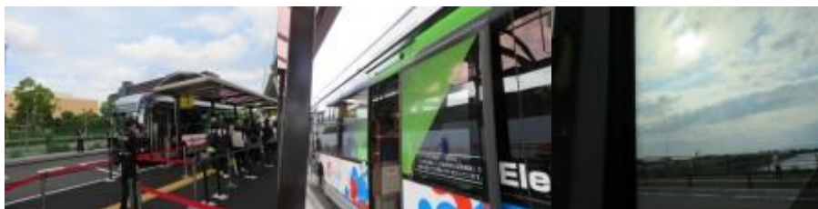
※万博会場へのアクセス