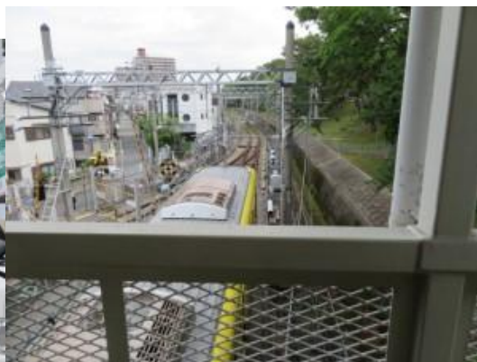
武庫川駅（黄色い電車でビックリ）