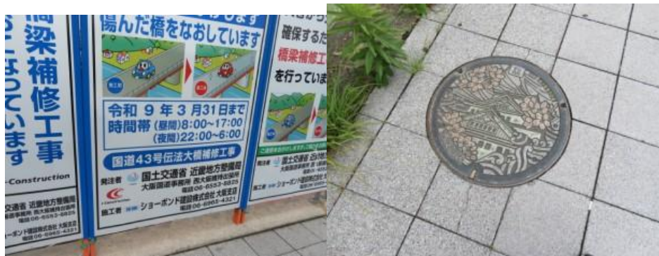
※工事の説明看板、大阪城のマンホール