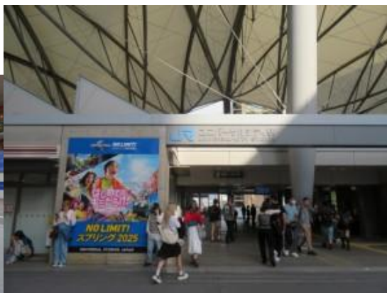
※ユニバーサル会場入口か？ ユニバーサルシティ駅