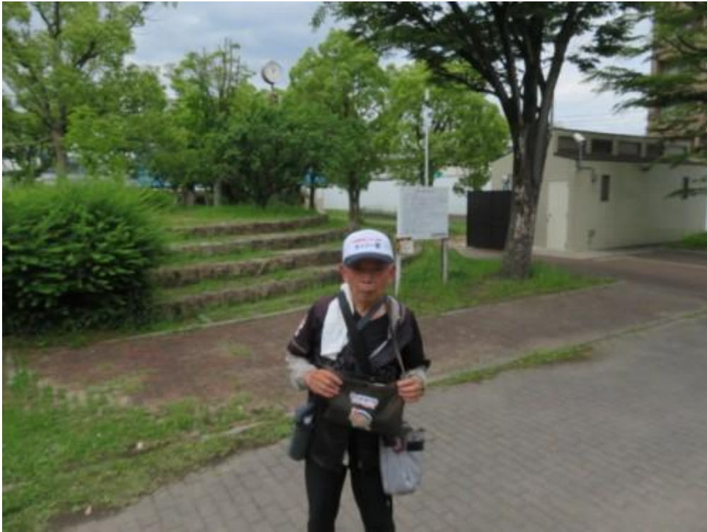
※扇町公園にて（駅はこの公園界限）