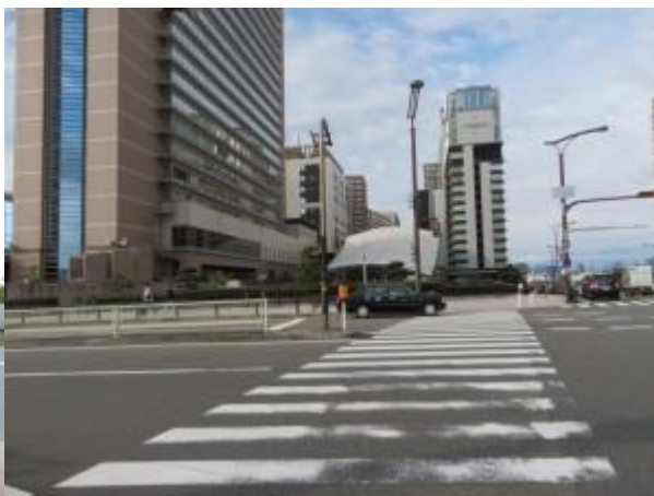
※ユニバーサルシティ駅への路